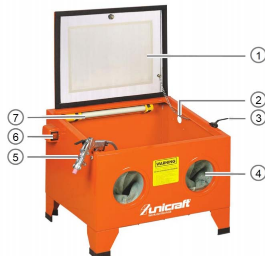
Abb. 3: Pískovací box SSK 1

Vyobrazení se může od skutečnosti lišit.