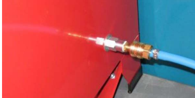
Abb. 6: Připojení vedení stlačeného vzduchu

Vlhký stlačený vzduch negativně ovlivňuje průtok abraziva a může vést k ucpání ventilů a vedení.