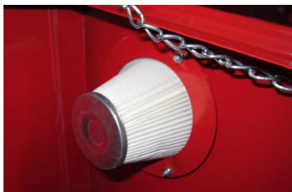
Abb. 4: Montáž filtru

Krok 1: Otevřete víko boxu a našroubujte přiložený filtr na odvětrávací otvor vpravo nahoře (Obr. 4).