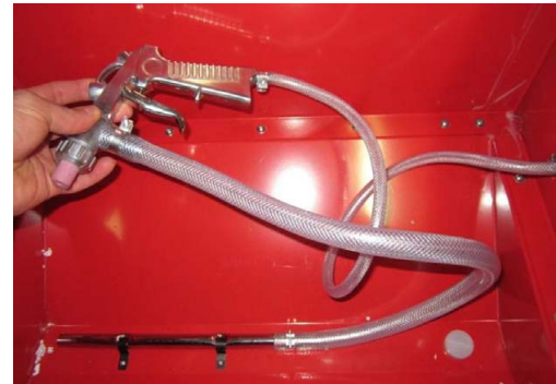
Abb. 5: Montáž vedení

Krok 3: Zkontrolujte pevné dotažení všech šroubů a matic.